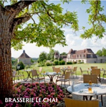
BRASSERIE LE CHAI