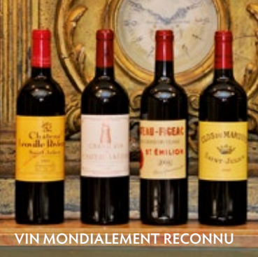
VIN MONDIALEMENT RECONNU