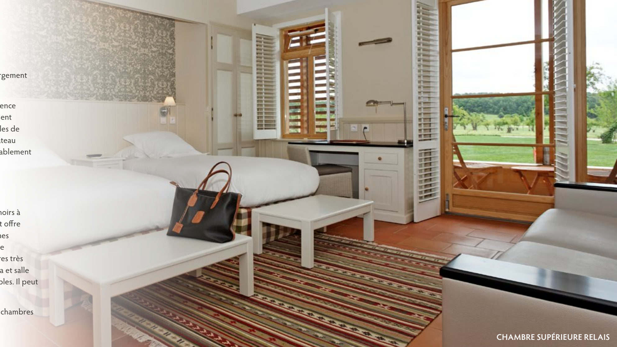
CHAMBRE SUPÉRIEURE RELAIS

La combinaison de ces trois bâtiments donne un total de 85 chambres et suites pouvant accueillir jusqu'à 150 délégués.