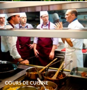
COURS DE CUISINE